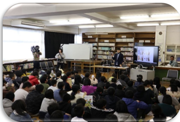
徳島市立八万小学校6年生を対象に行われた 認知症キッズサポーター養成講座での風景