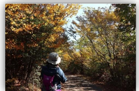
中津峰山にて(2022年11月)